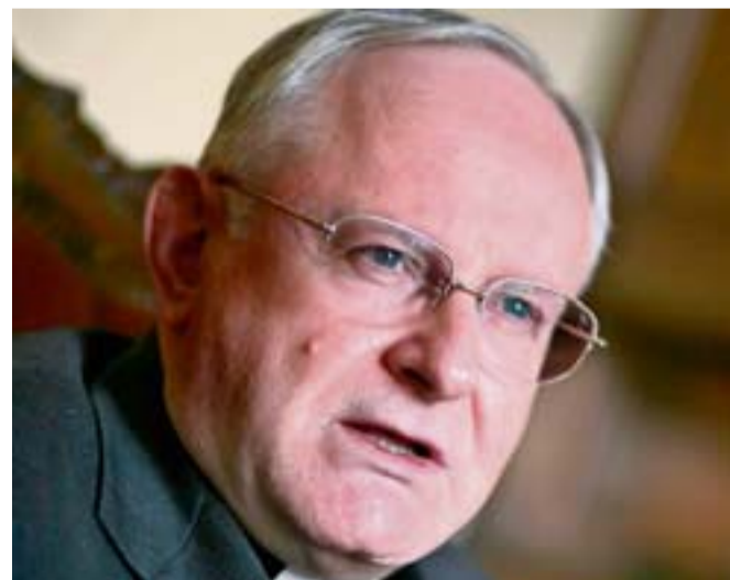
Il vescovo di Verona monsignor Giuseppe Zenti

Iniziano monsignor Zenti e don Masina, che citano più volte i richiami di papa Benedetto XVI sulla «disintegrazione del mondo giovanile» e sulla «emergenza educativa», spiegando come l'iniziativa nasca dall'intento di mettere in rete tutte le risorse per «venire incontro a un pianeta giovani in ebollizione». E sul «lavorare tutti insieme per fare prevenzione» insiste il prefetto Fortunati, perché «le istituzioni ottengono risultati se tutti stanno vicini». Anche il questore ribatte il concetto del «fare squadra, non solo quando accadono eventi come quello di questi giovani che hanno fatto brando, ma soprattutto prima. Lo Stato siamo tutti quanti noi e bisogna fare squadra nelle famiglie, nelle scuole, nelle associazioni, nelle parrocchie, bisogna fare in modo di raggiungere i giovani, di confrontarsi, parlare, dialogare con loro. L'augurio», conclude Stingone, «è che il sacrificio della povera vittima sia di monito a tutti quei ragazzi che vivono come stile di vita l'aggressività, l'intolleranza, le prepotenze, le provocazioni. Dobbiamo arrivare a loro e farli ragionare». Prende le difese della città