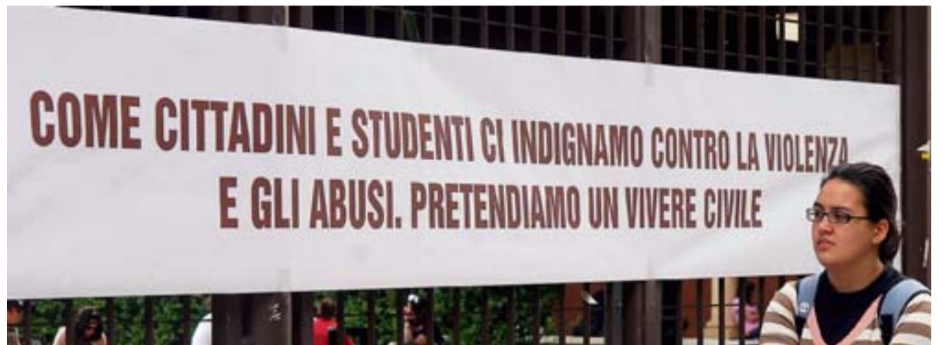
Lo striscione apparso sui cancelli dell'università in via San Francesco. I giovani si interrogano sull'accaduto